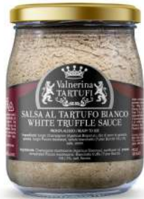
SALSA AL TARTUFO BIANCO NEW WHITE TRUFFLE SAUCE NEW 500 g / cod. STBN500 EAN CODE: 8053629680469

PALLET 120 x 80 x 175 cm cartoni per strato / boxes per layer: 24 n° strati / no. of layers: 17 tot cartoni / tot boxes: 408