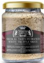
SALSA AL TARTUFO BIANCO NEW WHITE TRUFFLE SAUCE NEW 90 g / cod. STBN90 EAN CODE: 8053629680414

PALLET 120 x 80 x 175 cm cartoni per strato / boxes per layer: 24 n° strati / no. of layers: 17 tot cartoni / tot boxes: 408