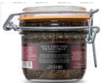
SALSA TARTUFATA IN VASO ERMETICO/ TRUFFLE SAUCE IN AIRTIGHT JAR 5% 180 g / cod. ST180E EAN CODE: 8053629678411

PALLET 120 x 80 x 175 cm cartoni per strato / boxes per layer: 8 n° strati / no. of layers: 11 tot cartoni / tot boxes: 88