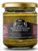
PESTO DI PISTACCHIO PISTACHIO PESTO 180 g cod. PP180 EAN CODE: 8053629698518