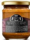
PESTO ROSSO CON TARTUFO RED PESTO WITH TRUFFLE 180 g / cod. PRT180 EAN CODE: 8053629681848 SID NUMBER: 2011-07-08/001