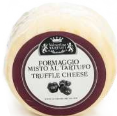
FORMAGGIO MISTO AL TARTUFO TRUFFLE CHEESE 300/400 g / cod. FT1000 EAN CODE: 8053629682401