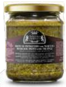
PESTO DI PISTACCHIO CON TARTUFO PISTACHIO PESTO WITH TRUFFLE 180 g / cod. PPT180 EAN CODE: 8053629671603