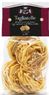
TAGLIATELLE AL TARTUFO BIANCO TAGLIATELLE WITH WHITE TRUFFLE 250 g / cod. PTB250 EAN CODE: 8053629682258