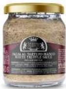
SALSA AL TARTUFO BIANCO NEW WHITE TRUFFLE SAUCE NEW 50 g / cod. STBN50 EAN CODE: 8053629680377