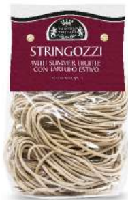
STRINGOZZI AL TARTUFO ESTIVO STRINGOZZI WITH SUMMER TRUFFLE 250 g / cod. PST250 EAN CODE: 8053629682234