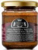
SUGO PRONTO AL TARTUFO TOMATO SAUCE WITH TRUFFLE 180 g / cod. SPT180 EAN CODE: 8053629681831