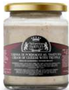
CREMA DI FORMAGGI E TARTUFO CREAM OF CHEESE AND TRUFFLE 90 g / cod. CFT90 EAN CODE: 8053629681619