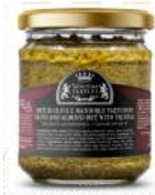
PATÉ DI OLIVE E MANDORLE TARTUFATO OLIVE AND ALMOND PATÉ WITH TRUFFLE 180 g / cod. POM180