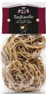
TAGLIATELLE AL TARTUFO ESTIVO TAGLIATELLE WITH SUMMER TRUFFLE 250 g / cod. PTN250 EAN CODE: 8053629682791