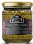
PESTO ALLA GENOVESE CON TARTUFO GENOVESE PESTO WITH TRUFFLE 180 g / cod. PVT180 EAN CODE: 8053629681855 SID NUMBER: 2011-07-08/002